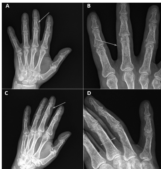
Figura 2. Radiografía de ambas manos (proyecciones frente (A y B) y oblicuo (C y D)). Con flechas blancas se señalan las zonas más evidentes de erosión ósea subperióstica.

En las radiografías de ambas manos (proyecciones frente y perfil) se constataron erosiones óseas subperiósticas en falanges (Figura 2) y, en un estudio tomográfico de abdomen sin contraste, se evidenciaron litiasis renal bilateral y calcificaciones del parénquima renal, compatibles con nefrocalcinosis. Se realizó videolarínfoscopia que mostró motilidad conservada de cuerdas vocales.